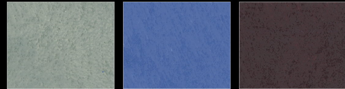
008 - 1 Toner* cod. 50081 024 - 1 Toner* cod. 50241 BOLD 1 cod. 5B001