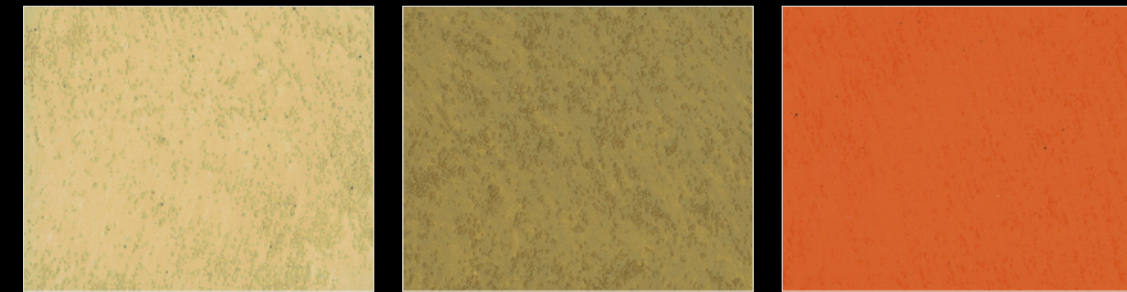
009 - 1 Toner* cod. 50091 033 - 1 Toner* cod. 50331 027 - 1 Toner* cod. 50271