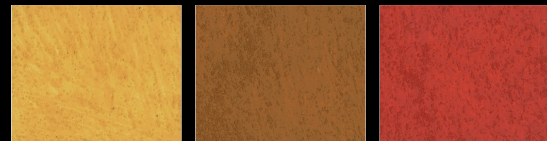
BOLD 6 cod. 5B006 022 - 1 Toner* cod. 50221 028 - 1 Toner* cod. 50281