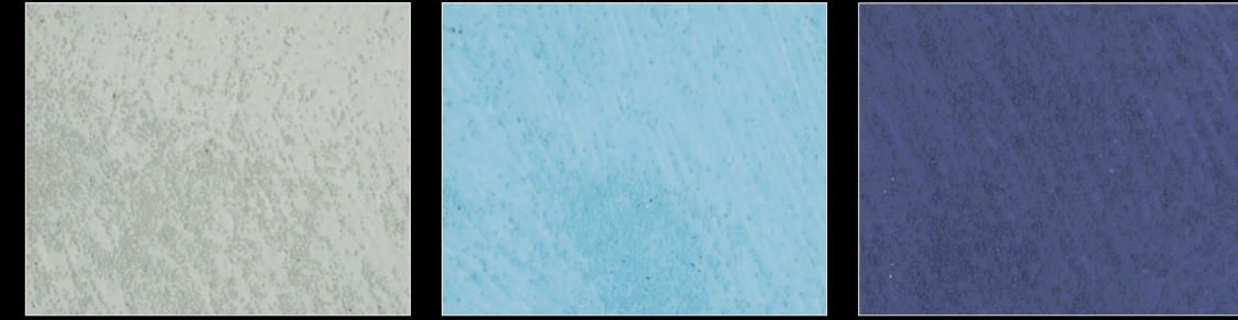
032 - 1 Toner* cod. 50321 014 - 1 Toner* cod. 50141 BOLD 4 cod. 5B004