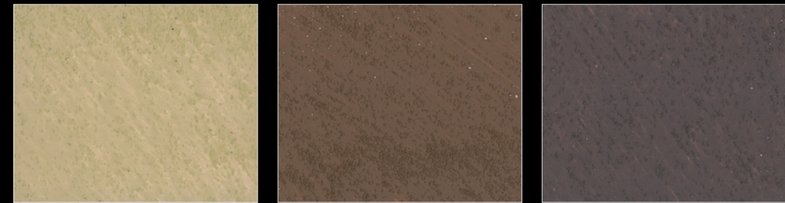
005 - 1 Toner* cod. 50051 036 - 1 Toner* cod. 50361 BOLD 5 cod. 5B005