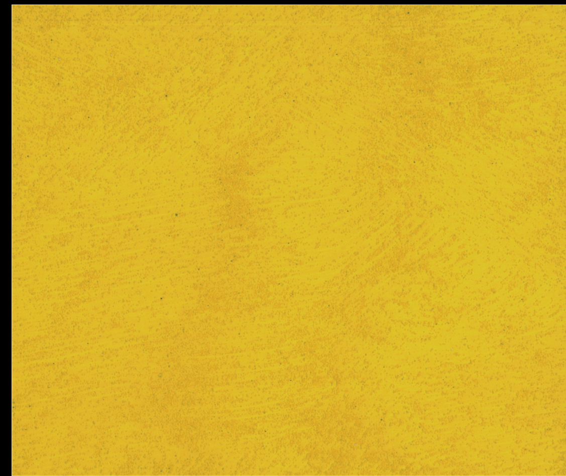
021 - 1 Toner* cod. 50211