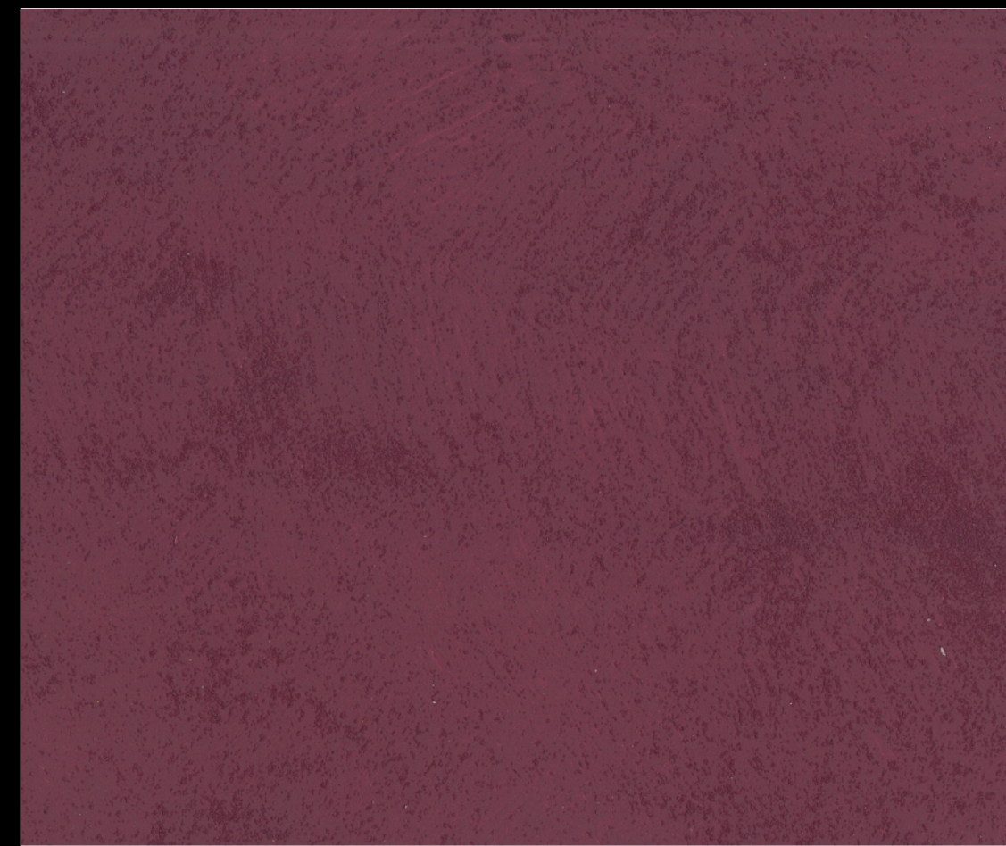
025 - 1 Toner* cod. 50251