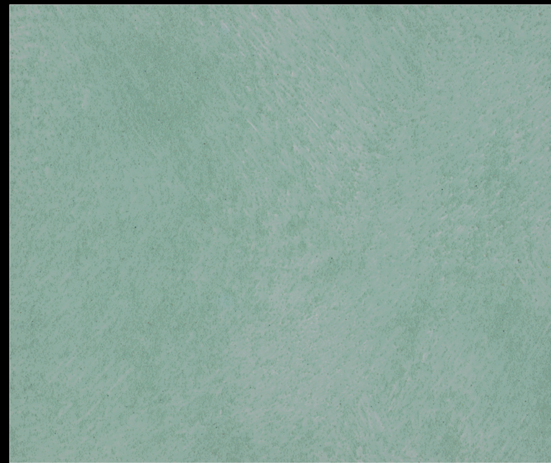
007 - 1 Toner* cod. 50071