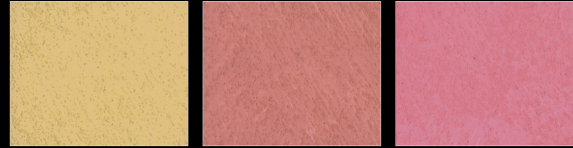
001 - 1 Toner* cod. 50011 017 - 1 Toner* cod. 50171 018 - 1 Toner* cod. 50181