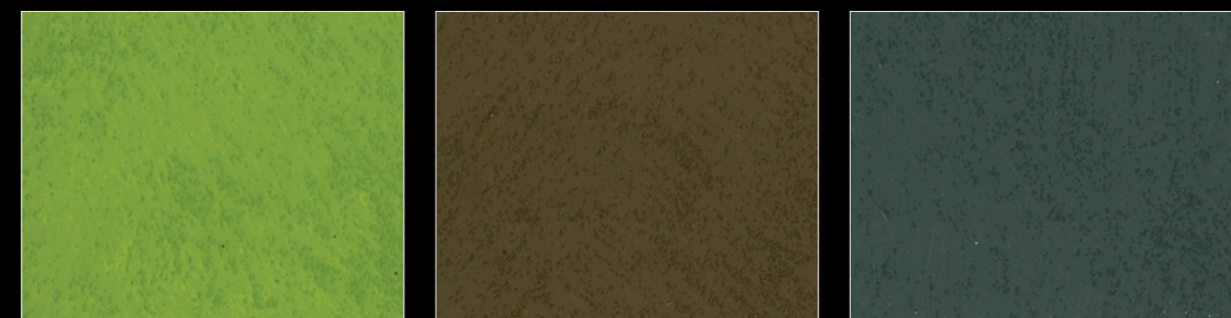
023 - 1 Toner* cod. 50231 BOLD 3 cod. 5B003 034 - 1 Toner* cod. 50341